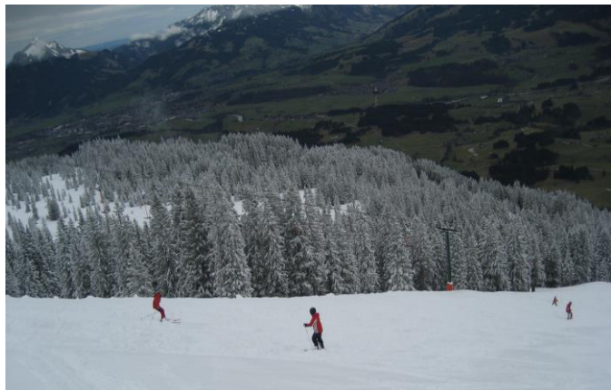
Ausfahrt 2009: Neuschnee am Weiherkopf