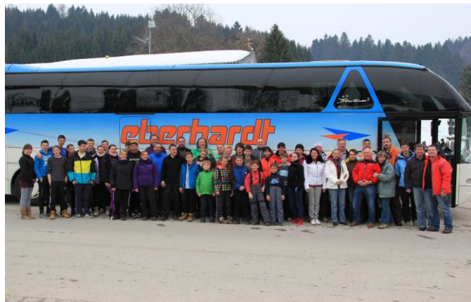
Die Teilnehmer der letzten TV-Skiausfahrt